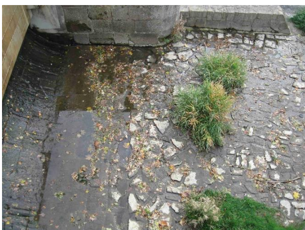
Přechod opevnění jezového tělesa na dlažbu v podjezí