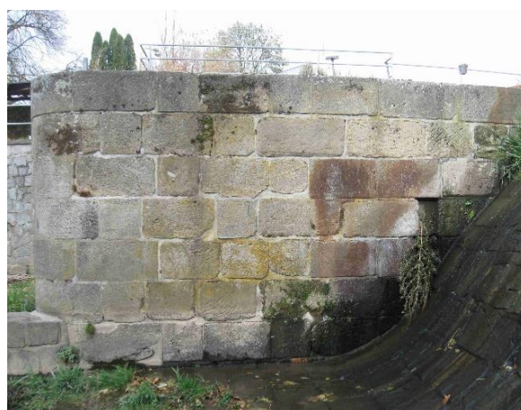
Svislá stěna středního pilíře