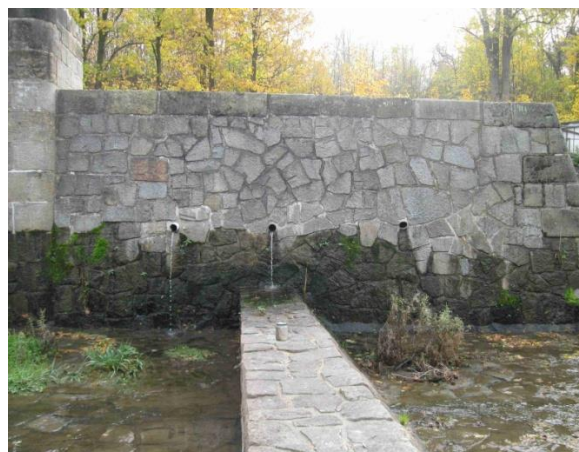
Svislá stěna mezpilíře s doplněným odvodněním