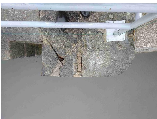
Poruchy zhlaví pravého pilíře