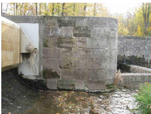
Svislá stěna středního pilíře