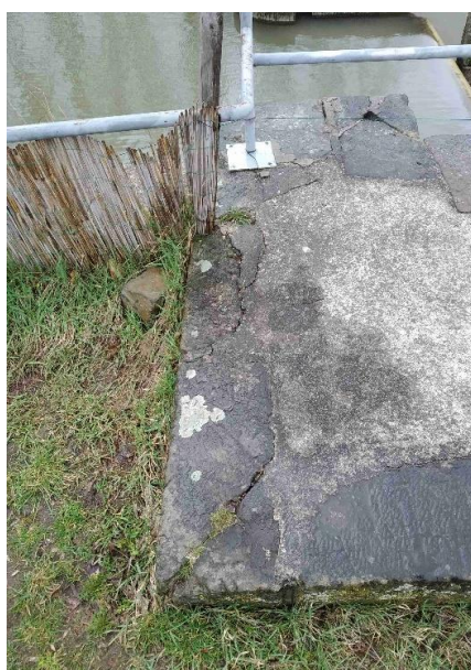
Poruchy zhlaví pravého pilíře