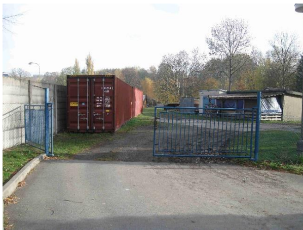
Přístup na staveniště