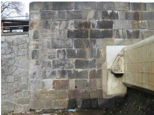
Svislá stěna pravého pilíře