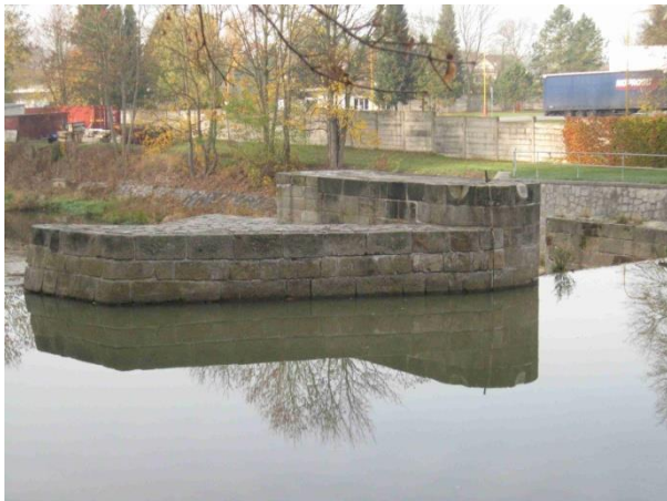
Pohled na mezpilíř z návodní strany