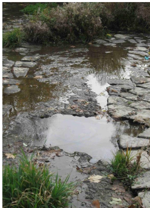
Kaverna v betonovém závěrečném prahu