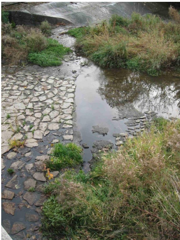
Profil pro nový závěrečný práh