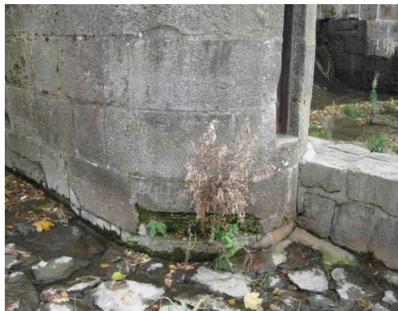
Odmrzlý kámen na středovém pilíři pohyblivého jezu