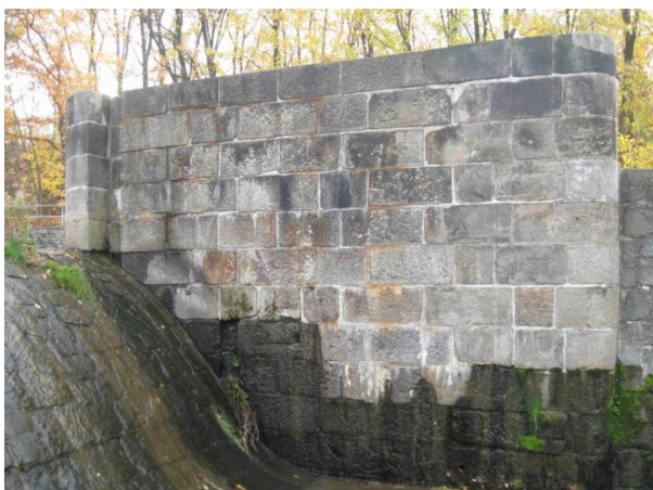
Levý pilíř původního pohyblivého jezu, průsaky